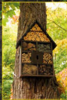
LESNÍ HMYZÍ BUDKA

Tento materiál vyšel za podpory Hlavního města Prahy a MČ Praha 10 v rámci projektu EkoporadnyPraha.cz v roce 2020 www.praha.eu www.praha10.cz www.ekoporadnypraha.cz